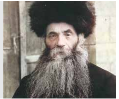
נדריים דף כח