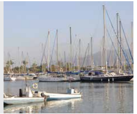
נדריים דף ל