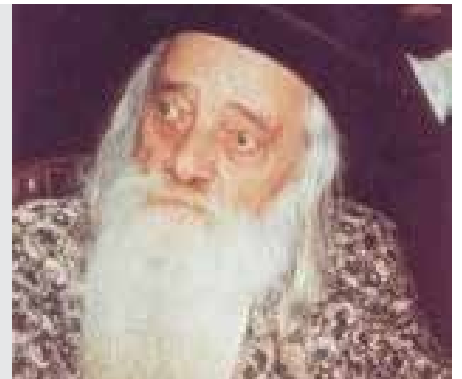
נדריים דף ז