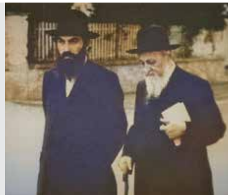
סוטה דף מ"ב