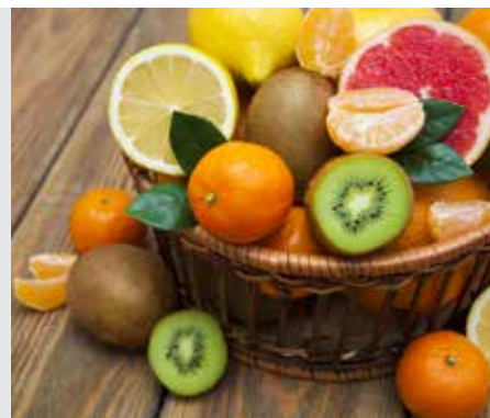
נדירים דף מד

דקה מתוקה - שישים שניות מרתקות על הדף היומי