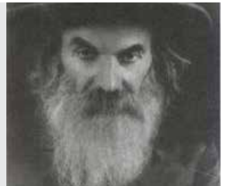
נדרים דף מט