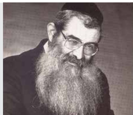
נדרים דף לו