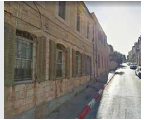
נזיר דף נ"ט