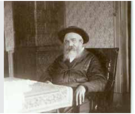
נזיר דף ג