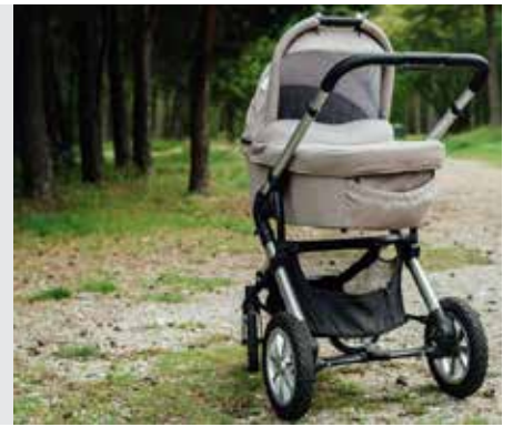
נזיר דף יג