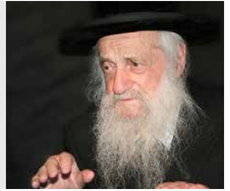
נזיר דף טז