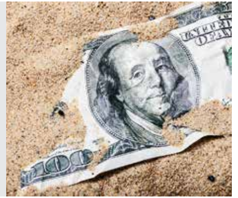
נזיר דף כ"ד