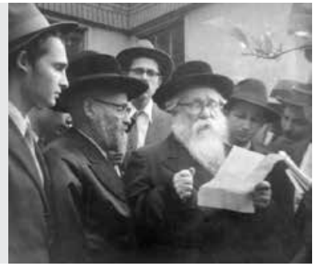
נדרים דף עה