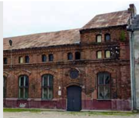
גיטין דף פד