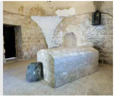
קידושין דף ט"ו