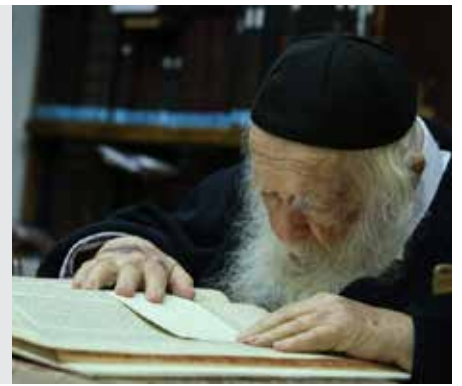
קידושין דף ח