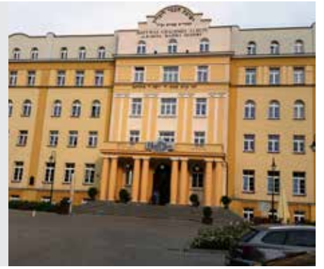
גיטין דף י"ד