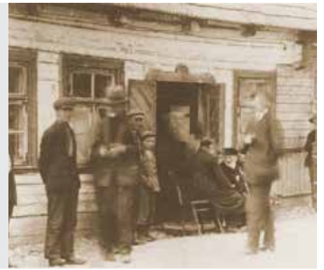
גיטין דף כמ