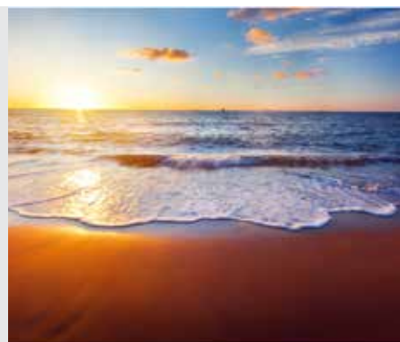
גיטין דף ח'