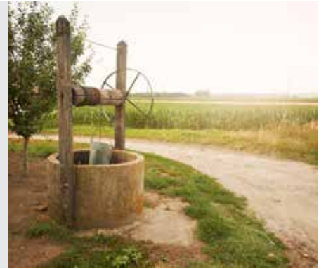
גיטין דף סא