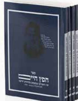
בבא קמא דף כ"א