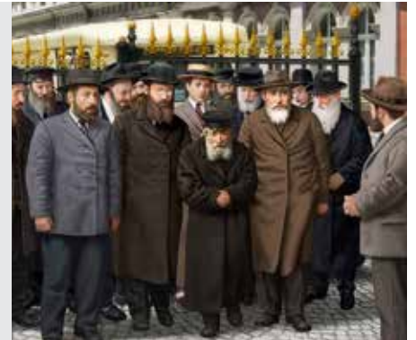
בבא קמא דף ל"ג