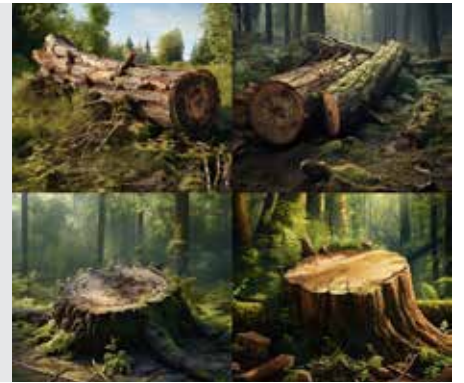
בבא מציעא דף צט