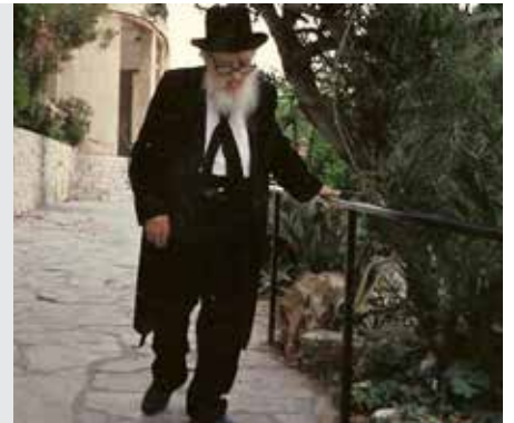
בבא קמא דף צו