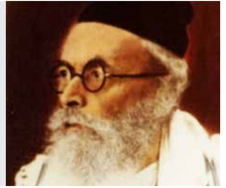
בבא מציעא דף קיז