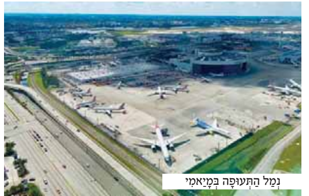
נמל התעופה במיאמי

אך סיים תפלתו, והנה אור נדלק באפלת הלילה. דלתו של אחד הבתים בקרבת מקום נפתחה, ומבעד לפתח השתרך לאטו יהודי קשיש הנשען על מקלו. יהודה התקרב, האיש סיים לרדת במדרגות והתישב על ספסל סמוך.