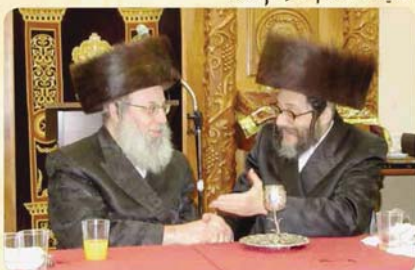
הנה"צ אב"ד סאנטוב שליט"א מיט הנה"צ אב"ד סקולען לעיקוואוד שליט"א