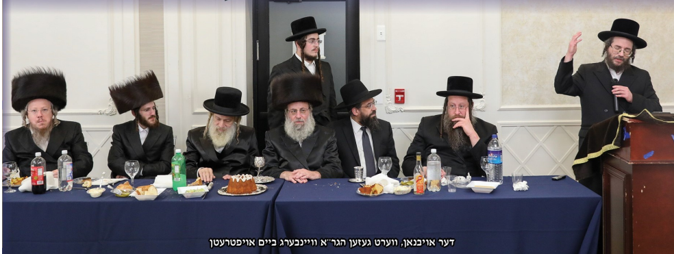
דער אייבנאן, ווערט געזען גר"א וויינבערג ביים אויפטערעטן