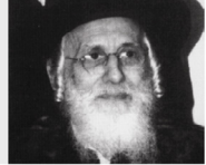
ליונא דהילולא של ב"ק מרן אדמו"ר רבי שלמה (השני) מבאבוב זצ"ל