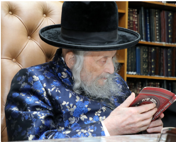
כ"ק גאב"ד ירושלים זי"ע לפני כמה חדשים מעיין בספר "נועם שיח"