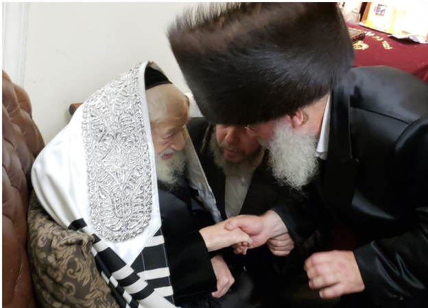
הרה"ק מסקולען זי"ע כמה חדשים לפני הסתלקותו מברך את הרב שליט"א