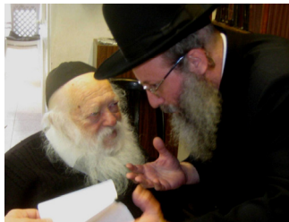
ובבו(א)"ה לפני המלך...