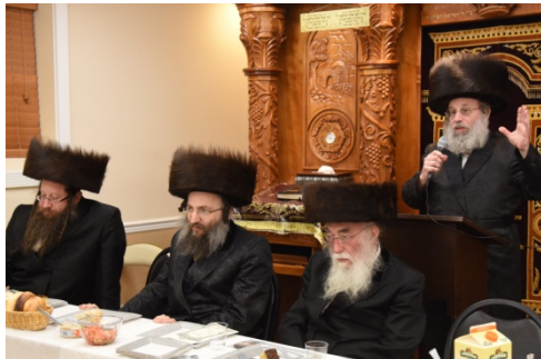
הגה"צ אב"ד סאנטוב שליט"א טרעט אויף

7 דער איד בילדער | פרייטאג פ' כי תשא תש"פ