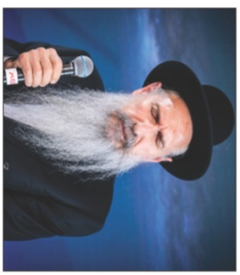
Mordechai ben David