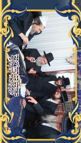
באונת פני המזרחית נכבדו הרבנים