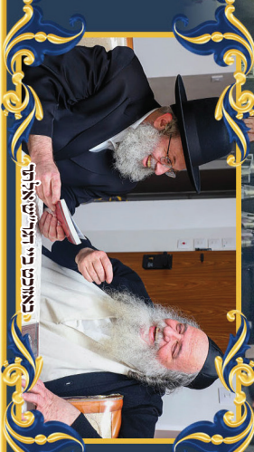
באונת פני המזרחית נכבדו הרבנים