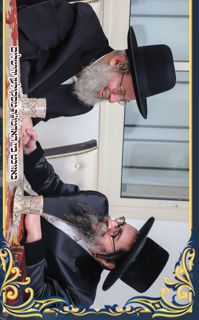
באונת פני המזרחית נכבדו הרבנים