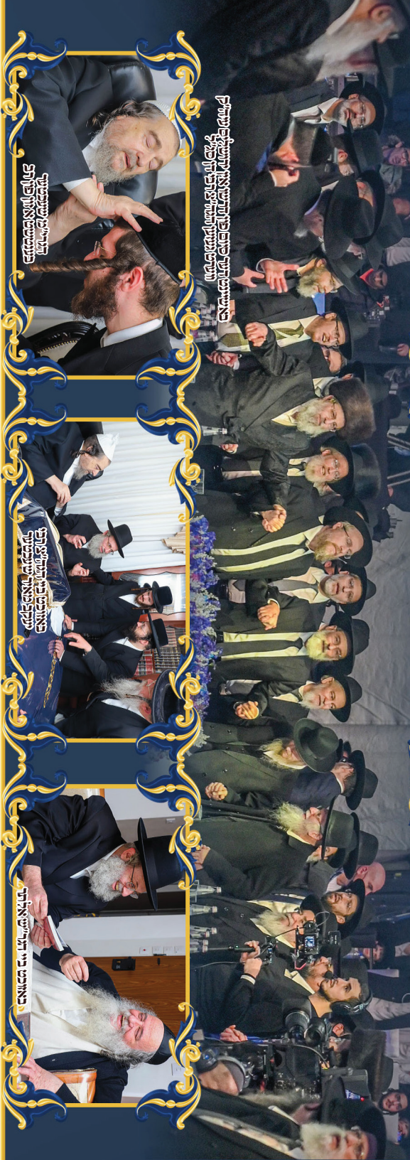
באונת פני המזרחית נכבדו הרבנים