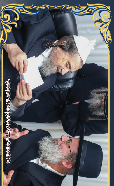
באונת פני המזרחית נכבדו הרבנים