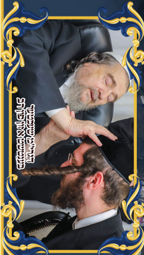
באונת פני המזרחית נכבדו הרבנים