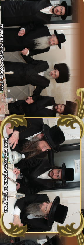
ווערמאָסטראָפּאָל און אַלע אַנדערע אָרטער פֿון דער רעפּובליק פֿון אַרמעניע