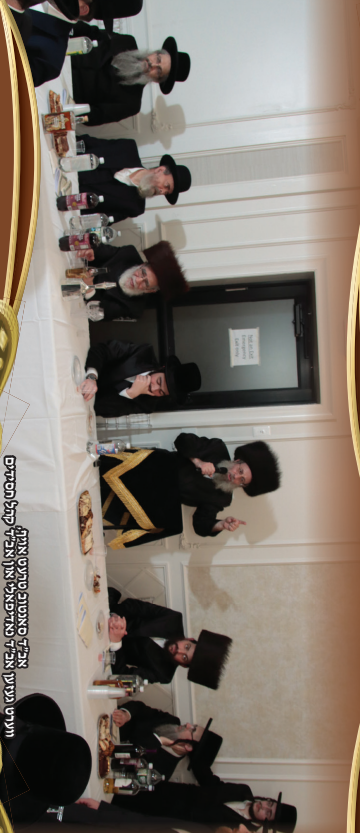
ווערמאָסטראָפּאָל און אַלע אַנדערע אָרטער פֿון דער רעפּובליק פֿון אַרמעניע