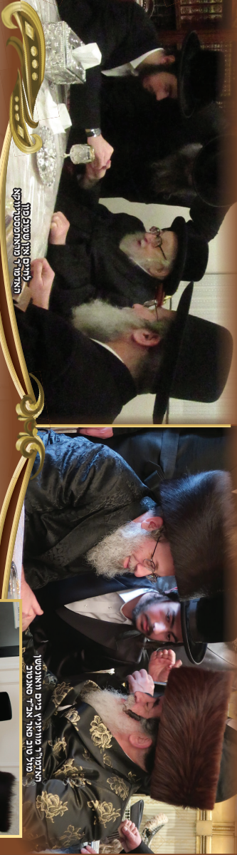
האָרמאָל פֿאַרמאָסטראָפּאָל לעבן און שטעט פֿון