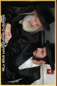
אָרט פֿון דער רעפּובליק פֿון אַרמעניע