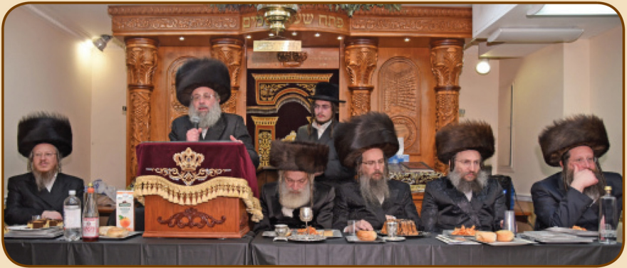
עס טרעט אויף דער רב שליט"א; געזען הרבנים מדעעש, שעדליץ, בראד, סערעט-וויזניץ, שליט"א