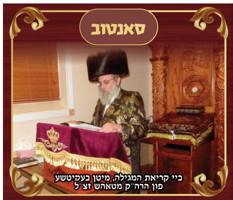
ביי קריאת המגילה, מיטן בעקטשע פון הרה"ק מטאהש זצ"ל